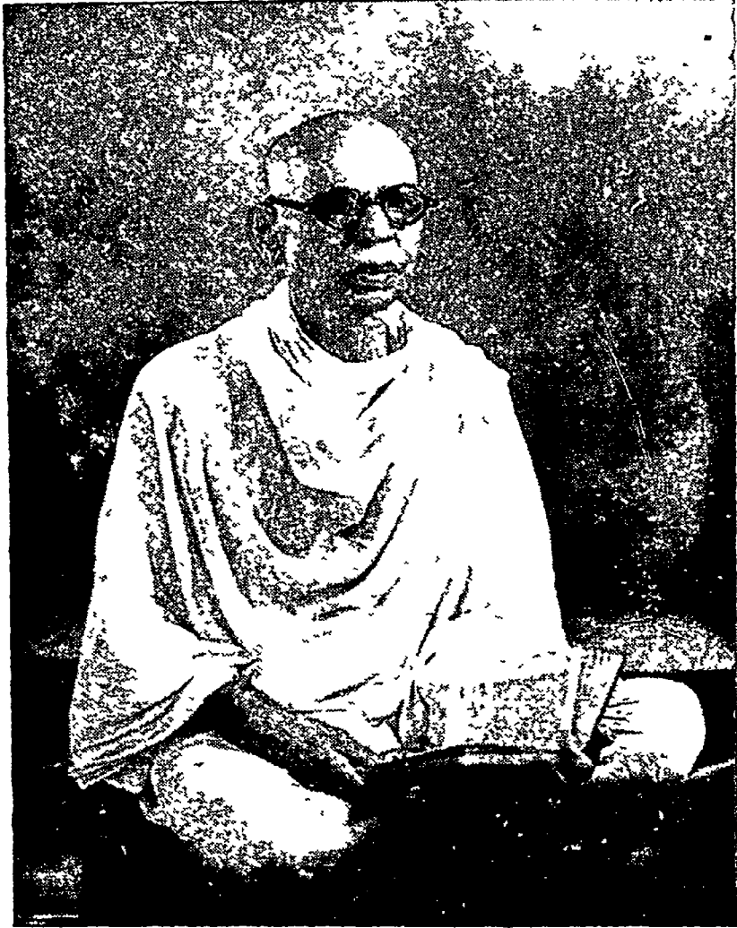
स्व ब्र जीवराज गौतमचन्द्र दोषी स्व रो. ता. १६-१-५७ (पौष शु. १५ )